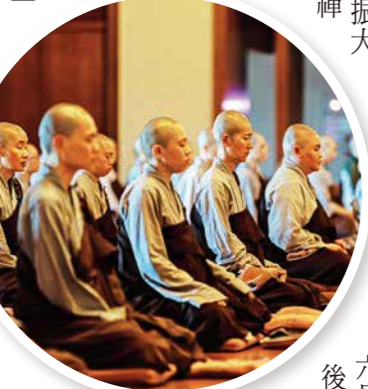
法師們把握結夏因緣，回到禪堂精進用功。

【本刊訊】六月一日起，僧團展開一年一度的結夏安居，近二百位海內外僧眾暫時放下繁忙法務，回到禪堂用功。本次安居由兩地同步展開，總本山禪堂由聖嚴師父法雲師長帶領精進禪修；高雄紫雲寺則以誦經、拜懺為主。安居期間，大眾攝心用功、精勤不懈，充分展現向道辦道的願心。