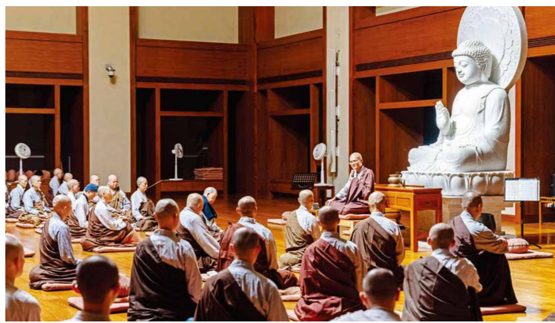
方丈和尚至總本山禪堂開懷，並勉勵僧眾在安居中用功辦道，持續推動法鼓山的理念，利益眾生。

【本刊訊】六月一日起，僧團展開一年一度的結夏安居，近二百位海內外僧眾暫時放下繁忙法務，回到禪堂用功。本次安居由兩地同步展開，總本山禪堂由聖嚴師父法雲師長帶領精進禪修；高雄紫雲寺則以誦經、拜懺為主。安居期間，大眾攝心用功、精勤不懈，充分展現向道辦道的願心。