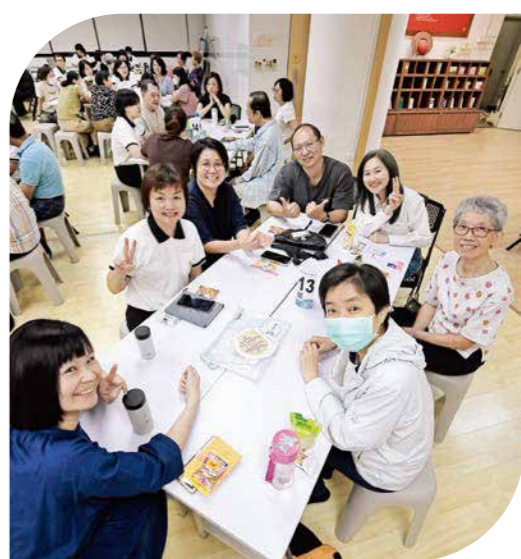
▲新加坡班與農禪班連線上課，結業學員向同學與授課法師表達謝意。

今年圓滿三年課程的班級中，農禪寺甲、乙兩班共有二百二十位學員結業。典禮中，學員透過佛學測驗、練習禪修，到參與福出場的點滴。有學員分享，佛法讓自己學會覺察與接納，也讓家庭關係變得和諧；這些轉變，都是三年共學慢慢累積的力量。