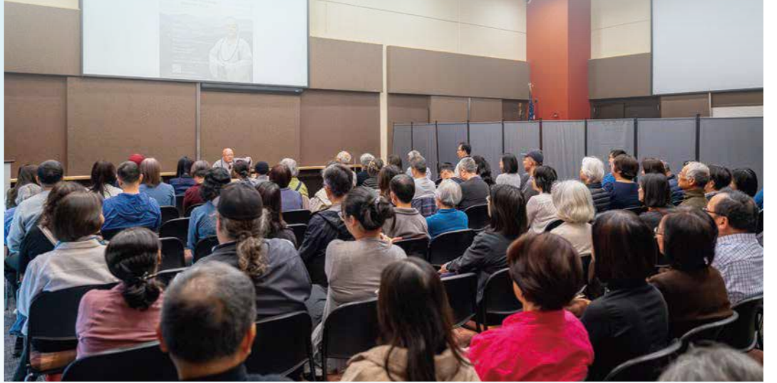
▲退居方丈分享佛法安心的方法，引領聽眾以正向態度，將壓力轉化為成長力量。

【西雅圖訊】如何以佛法的智慧，來面對經濟不景氣、工作和家庭壓力，以及 AI 科技引發的虛幻和焦慮？五月底，退居方丈果東法師北美關懷行來到西雅圖分會，五月三十一日並於當地 King County 圖書館行政中心進行「願行人間，觀世自在」公開講座，與近九十位聽眾分享佛法安心的方法，引領聽眾將壓力轉化為成長的力量，以願力開展觀世自在的人生。 「面對變遷環境，觀照起伏動靜；得體處世行徑，心如止水明鏡。」講座一開始，退居方丈以〈安心祝福語〉的偈語，指出外在環境時時在變，真正的安定來自內心。談到現代人普遍恐懼「無常」變化，退居方丈表示，無常在現象上雖有失去與變壞，但同時也是改變與成長的契機，若能以正向態度看待，「成功是收穫，失敗是體驗」，逆境即是修福修慧的資糧。 在日常實踐上，退居方丈提出「身心安頓四步驟」：以慚愧悔來洗滌身心，以體驗當下來收攝身心，以身到心到安住身心，以一念起即覺「自在身心」。在人際互動與工作中，分享以「理解現象、包容狀況、耐心溝通」來處理人我差異，秉持「奉獻即是修行，安心即是成就」的信念，所有的承擔就不會變成負擔，而是成長的動力。 談及願力的實踐，退居方丈表示，修行是從「小我」走向「無我」的轉化歷程，並以「發願、祈願、許願、行願、還願」五個層次，說明願力落實的過程，勉勵聽眾只要願心發願、踏實行願，生命便不再隨歲月流逝，而是持續增長智慧與慈悲。 現場問答時，有聽眾提問何謂六道輪迴？除了信仰層面，退居方丈說明生活中也有輪迴。當起了瞋心，便如同身處地獄道；起貪心如同餓鬼道，愚昧不明是畜生道，愛與人爭鬥則是阿修羅道。退居方丈藉此提醒聽眾，修行的重點在於時時覺察起心動念，當下轉化習氣，而不是被習氣牽著走，一再地輪迴。 也有聽眾提問夫妻相處之道，退居方丈幽默地建議，不妨把另一半視為成就自己修行的菩薩。若能心存感恩、互相提醒、包容體諒，家庭生活就是最好的修行道場。