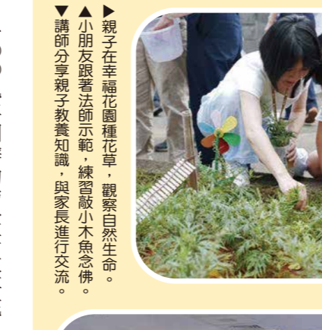
▲親子在幸福花園種花草，觀察自然生命。小朋友跟著法師示範，練習敲小魚念佛。講師分享親子教養知識，與家長進行交流。

從鐵皮屋時代舉辦的兒童班，到心靈環保兒童體驗營，隨著農禪寺水月道場落成啟用後，專屬兒童的弘化方式，是隨著空間環境的改變而變遷。經過多年醞釀，在大眾殷切期盼下，農禪寺兒童班於二〇二四年三月正式開班！ 有別於兒童專屬的課程，農禪寺兒童班強調「親子共學」，家長和孩子有別個別的課程，也有一起參與的部分，透過共同主題的同步學習，建立共同的價值觀，落實佛法家庭的理想。 每半年一梯次的兒童班，課程主軸即是心靈環保與四種環保，依主題設計課程，內容包括學佛行誼、遊戲、手作、佛菩薩故事、作業分享等，家長