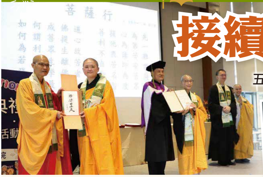
▲方丈和尚、陳定銘校長、鄧偉仁老師等師長們，為文理學院畢業生頒發證書與結緣品。