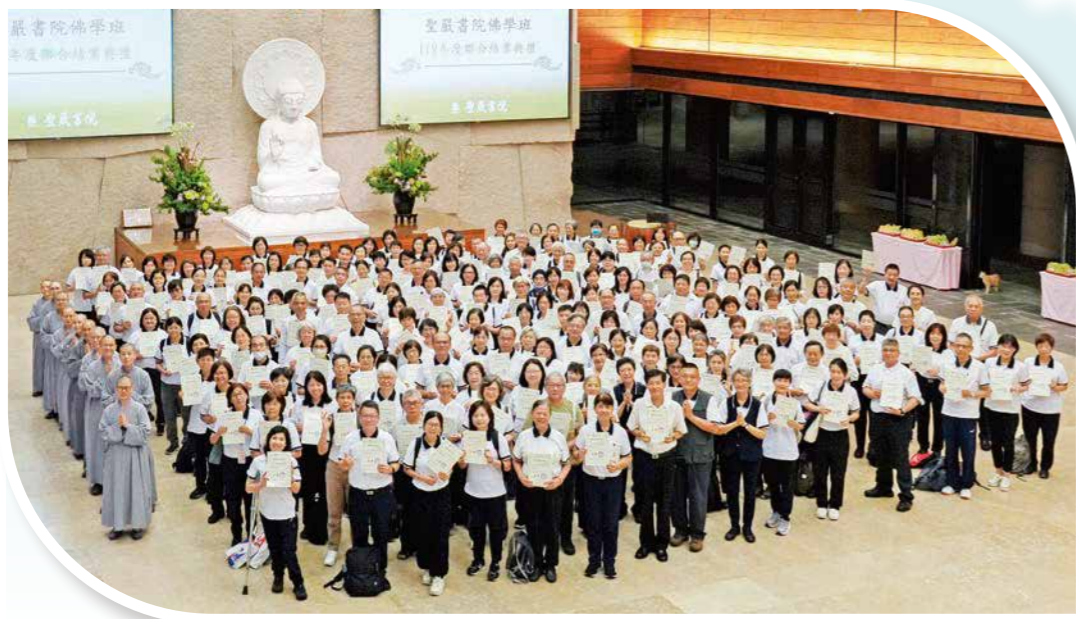
▲農禪班結業學員與授課法師們在水月道場的大殿，共同發願為成就人間淨土而努力。(陳伯昌攝)