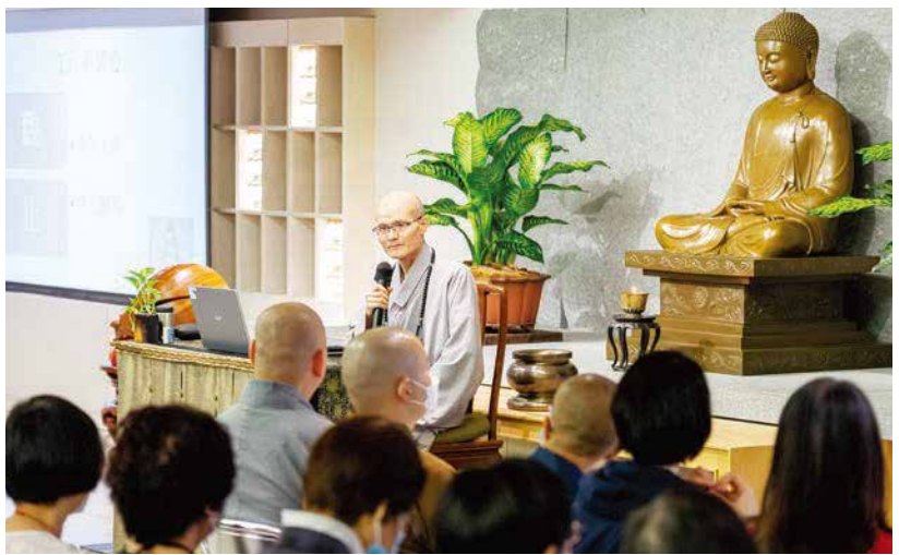
◀方丈和尚與香港信眾分享如何在生活中練習止觀法門，帶來幸福的生活。

「由於現代人生活步調急促，易受外界的影響，所以更須重視『心』的自在。」八日晚間的專題演講，方丈和尚指出，真正的幸福是身心健康，尤其是心情的平和與安定。日常生活中如何練習？「身在哪裡，心在哪裡；清楚放鬆，全身放鬆，這十六字箴言便是最好的止觀法門。」方丈和尚分享，無論行住坐臥，都可練習「心」只做一件事，讓自己保持清楚明白，了了分明，這樣身心都能放鬆自在，隨時自然可以得心應手。方丈和尚也鼓勵大眾隨時提起「阿彌陀佛」或「觀音菩薩」的聖號，就能幫助自己安心面對生命中的各種難關。 講座圓滿後，方丈和尚關懷現場大眾，並與大眾結緣「六度木尺書籤」，代表「福慧自在」的關懷與祝福，鼓勵人人「修福修慧，大眾平安健康；六度萬行，人人身心自在」，藉由積極實踐布施、持戒、忍辱、精進、禪定、智慧，為人心帶來無限希望，為社會帶來嶄新氣象。