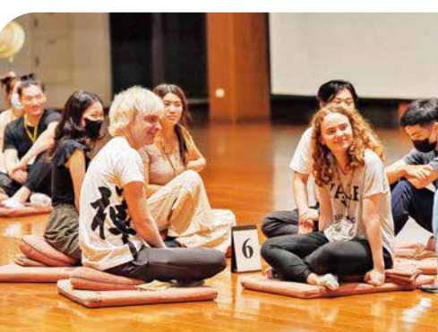
▲在天南寺禪堂裡，青年學子分組互動，分享彼此的感受和體驗。

走出舒適圈 ◎Hsiang Lo 我們總是習以為常地尋求舒適，因此，當既有的觀點和生活方式受到挑戰，很難保持開放的心去擁抱改變。來法鼓山之前，我無法預期會發生什麼，也不確定會得到什麼，然而，這趟旅行對於我的生命，確實產生了積極的影響。清晨的早課、禪坐，還有整個環境的平靜，打破了平日的生活狀態，走出了舒適圈。