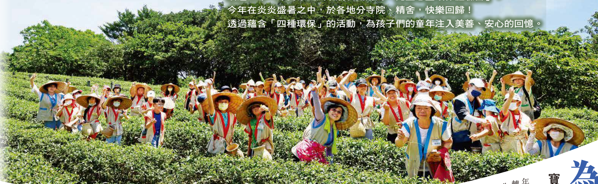
中山精舍 小小茶農採茶去

睽違三年，深受家長與小朋友期盼的「兒童心靈環保體驗營」，今年在炎炎盛暑之中，於各地分寺院、精舍，快樂回歸！