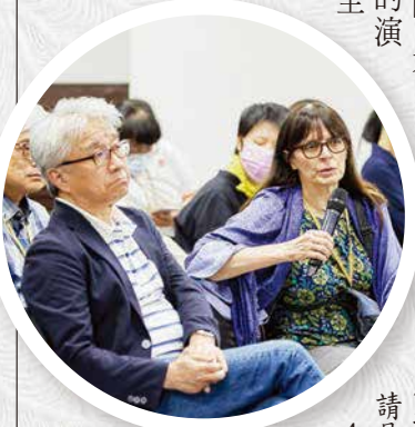
▲來自海外學者把握實體交流機會，向發表人提問。

在地化等跨領域的趨勢，這讓佛法在現代社會，不斷有推陳出新的研究趨勢，更有新生代力量的加入，開拓了現代青年學者的眼界。 回到宗教性與主體性 本屆研討會中，我提出研究聖嚴師父早期禪修層次演變的論文發表。當我在整理的過程中，常常有種跨入另一個時空，感受師父親自教導西方弟子禪法的場景。那是一種非常活潑、非常當下的應機施設，但也是無以言喻、唯有親歷其境者可以感知，師徒間以心心印心、轉化生命層次的經驗。這類的文獻資料，很難用學術語言呈現，卻也是我不得不面對的學術與修道之間的困境。 聖嚴師父曾說過，研究他這個人是可以從不同的角度、不同的領域來切入，但也非常明白地表示：「聖嚴法師的存在，是因為有一專注於佛教的某一特定領域。一即是融攝一切，又超越一切界限的「宗教思想家」。身為師父的弟子與研究師父思想者，我期望自己能在現代學術研究主流文化中，在跨領域的不同視角中，能時時回到漢傳佛教「宗教性」與「主體性」的內涵，同時提出可供諸方學者參考的文本時空脈絡、宗教家的思維與自內證經驗等研究成果。 (摘錄《人生》雜誌 480期)