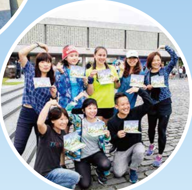
▶水月禪跑結合現代人的日常運動，年輕人呼朋引伴，一起來體驗動中禪。