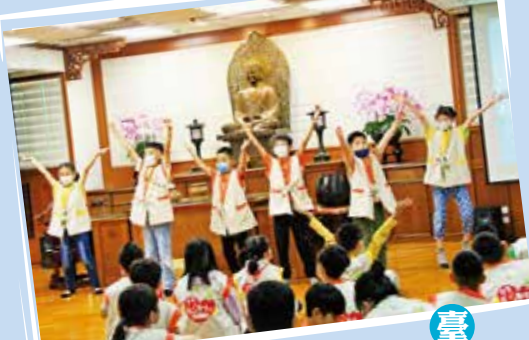
臺南分院 唱出一朵慈悲花

農禪寺 團隊精神過五關 循著導覽尋寶圖，農禪寺兒童營的小學員，在大殿、水月池、金剛經閣下，入慈悲門及開山農舍中，挑戰過五關！每一關有建築特色與源流的解說，還有融入「一〇八自在語」及佛法觀念的遊戲。