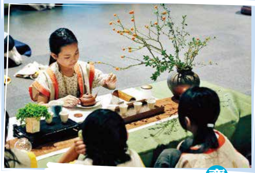
齋明寺 古寺中學當茶主人

齋明寺今年兒童營最特別之處，就是在禪堂廣設茶席，小學員跟著茶老師，學習煮水、沏茶、品茶，體驗漢傳佛教獨有的茶禪文化。