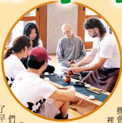
▶泡茶、倒茶、喝茶，每個動作都是禪的放鬆體驗。

我總是習以為常地尋求舒適，因此，當既有的觀點和生活方式受到挑戰，很難保持開放的心去擁抱改變。來法鼓山之前，我無法預期會發生什麼，也不確定會得到什麼，然而，這趟旅行對於我的生命，確實產生了積極的影響。清晨的早課、禪坐，還有整個環境的平靜，打破了平日的生活狀態，走出了舒適圈。