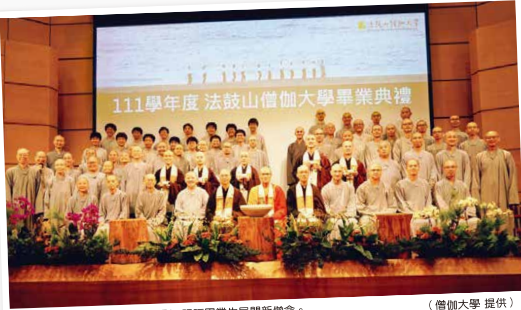
▲僧伽大學全體師生歡喜合影，祝福畢業生展開新生命。

維和素養，僅能治標不治本，因此如何回到人心的層面來思考永續教育，在在與「心靈環保」、「提昇人品、建設淨土」等理念，息息相關。因此，我們期許永續發展辦公室能在這個基礎上，發揮永續倡議的角色及功能，實現雙贏。 永續發展辦公室第一階段的成果「Impact Next 倡議視類」將於八月正式上線，透過 YouTube、Podcast 等數位平台，每週播出一集，邀請各界人士從自身的專業與經驗出發，提出永續倡議，議題涵蓋心靈環保、地方創生、永續教育、循環經濟、公共治理、性別平等、科技文化、人工智慧、國際關係等，面向多元、精彩可期，相信能帶動社會大眾對永續發展的關注與行動。 此外，辦公室還有一個重要任務，就是「編製年度永續發展報告書」，這是主動向社會彙報組織的永續舉措，永續發展辦公室也將扮演更積極的USR角色，促進學校與外部機構的互動，例如，近期文理學院受邀參與《遠見》雜誌「永續生態共好圈」會議等活動，這些都是好的開始。