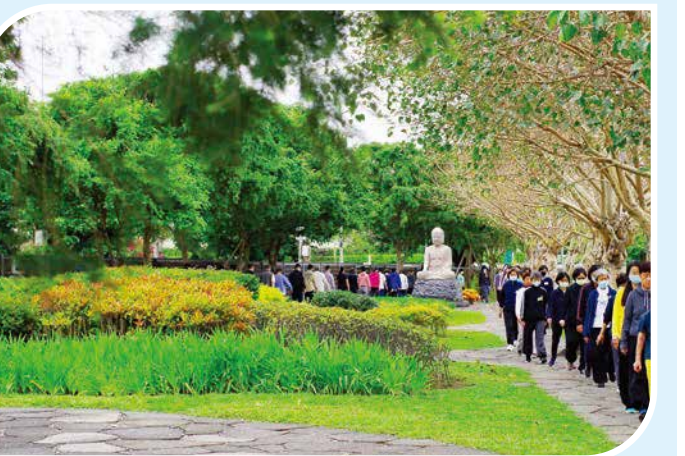
▲除了空間標示，水月道場內沒有任何禁止文字，來訪者少了散心雜話，多了回歸內在。