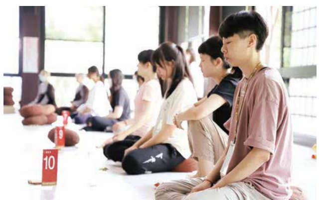
▲兩天的生活營中，中部青年學員練習放鬆身心，感受活在當下的自在。

七月十五至十六日，檳城佛學院週日學校舉辦「點亮我生命的自覺，享受育人的幸福」教職員工作坊。