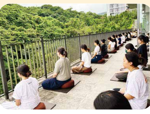
▲文理學院的層巒疊翠，學員從大自然中，體會內心的寧靜。

從佛法的源頭學起 ◎Bryan Liu 用齋時，深深被安靜的氛圍所感動。在快節奏的現代生活中，我們很少有機會去享受食物的味道，或與他人一起用餐，通常只是無意識地吞嚥食物，沒有任何