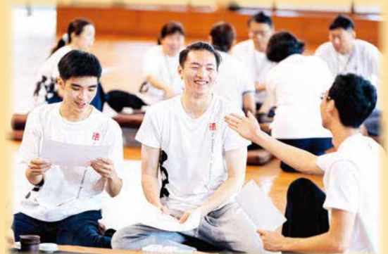
▲法鼓文理學院的茶禪活動，北美青年從公案中，體驗禪法的意趣。

6月28日，40位北美青年來到臺灣，展開一連七天的法鼓山巡禮。從天南寺、農禪寺、齋明寺，到總本山，北美青年有哪些感受和體驗？本期邀請學子們來分享這趟心旅程。