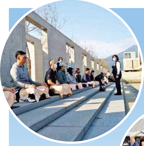
▲坐在水月池畔，尋禪而來的民眾靜下心，跟隨義工引導，體驗身心放鬆的感覺。

2012年底，聖嚴師父喻為「空中花，水中月」的水月道場落成，農禪寺從樸實的鐵皮建物群，蛻變成令人耳目一新的景觀道場，在喧囂的都會紅塵中，成為新一代信眾學佛修行的心靈家園。