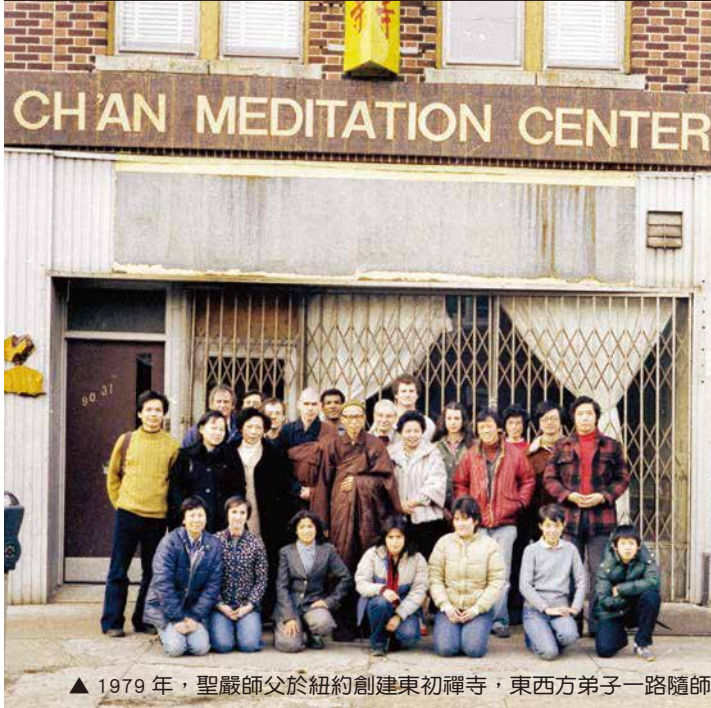
▲ 1979年，聖嚴師父於紐約創建東初禪寺，東西方弟子一路隨師學法護法。(本刊資料)