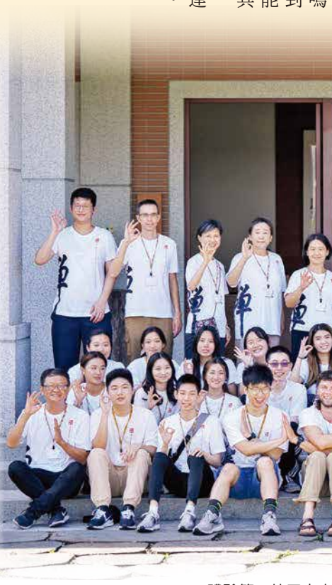
▲體驗第一天天南寺的寺院生活後，全體學員感謝大眾的照顧，歡喜合影。

走出舒適圈 ◎Hsiang Lo 我們總是習以為常地尋求舒適，因此，當既有的觀點和生活方式受到挑戰，很難保持開放的心去擁抱改變。來法鼓山之前，我無法預期會發生什麼，也不確定會得到什麼，然而，這趟旅行對於我的生命，確實產生了積極的影響。清晨的早課、禪坐，還有整個環境的平靜，打破了平日的生活狀態，走出了舒適圈。