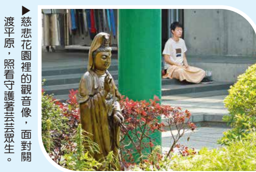
▲慈悲花園裡的觀音像，面對關渡平原，照看守護著芸芸眾生。