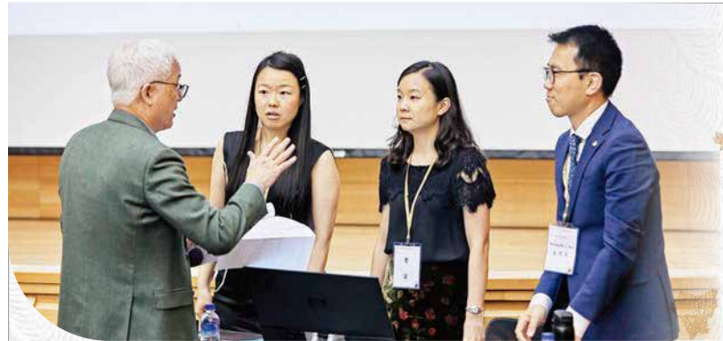
▲聖嚴思想研討會中，資深學者與青年學者齊聚互動交流，展現漢傳佛教學術研究的傳承與展望。

歷經疫情三年，能全程參與實際的第九屆聖嚴思想國際研討會，感受到在佛教學術研究上有許多新的局面，包括全新的研究領域、新的青年研究學者的出現，也有一些「借新舊文獻之探究」而發人省思之處。 佛法傳承與流布間 看見緣起法 研討會的專題演講，首先是衣川賢次教授演講的〈南宋臨濟禪初傳日本之研究〉以蘭溪道隆為例，非常簡意賅地道出了禪宗從一開始的出現，到南宋禪的形成功，都是一場禪法在「世俗化」與「聖典化」之間，此消彼長的歷程。衣川教授透過「整體的國家社會文化發展概況」、「宗教社會學」式的研究切入點，是非常值得學習與思考的新視角與論述方向。 陳玉女教授的〈從《嘉興藏》的海內外流通再思考明清佛教的歷史地位〉，闡述了有關《嘉興藏》真可禪師能結合民間力量，完成一部《大藏經》的結集極為艱難。數十年間一棒接一棒，歷經艱辛的刊刻、保存與流傳的過程，讓人極為動容與感佩。 二場演講所探討的主題，時空環境非常不同，卻同樣展現了佛法在城鄉之間、在社會菁英與平民百姓之間、在聖典化與普及化之間，不斷地往返擺盪與尋求平衡的演變歷程。這樣的歷程從古至今，一直都在流動變化，令人深刻體會到此生故鄉生，緣起法的真實義。 其他論文的發表，可看出佛法與禪修的研究，有走向世俗化、現代化、全球