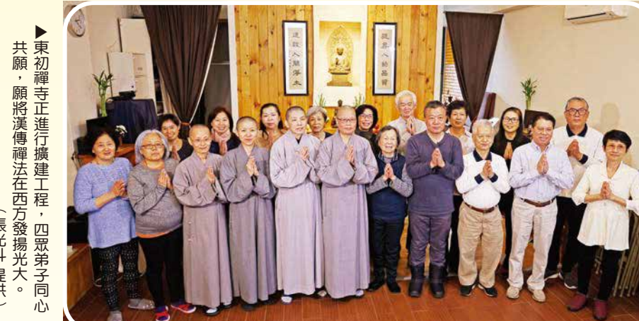
▲ 東初禪寺正進行擴建工程，四眾弟子同心共願，願將漢傳禪法在西方發揚光大。

《他的身影2》拍攝團隊於二〇二三年二月六日，與果元法師、演法法師一同搭機，由墨西哥飛休士頓，再轉紐約。沒料到，迎接我們的是零下三度的超低温。