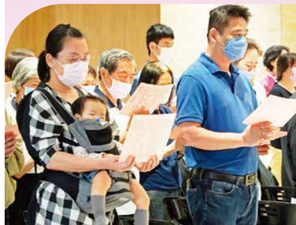
▲在母親懷抱中的小菩薩，一同參加寶雲寺的浴佛法會。