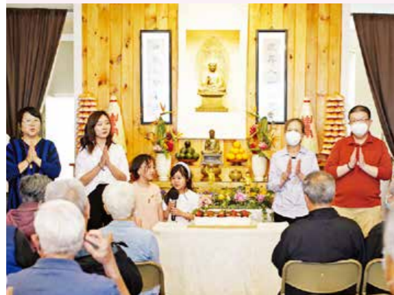
▲東初禪寺信眾在浴佛法會後，皈依成為三寶弟子，慶祝邁向學佛新生命。