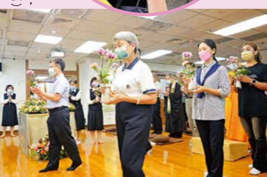
▲蘭陽分院浴佛法會前，大眾先於佛前供燈，以虔誠恭敬的心浴佛。