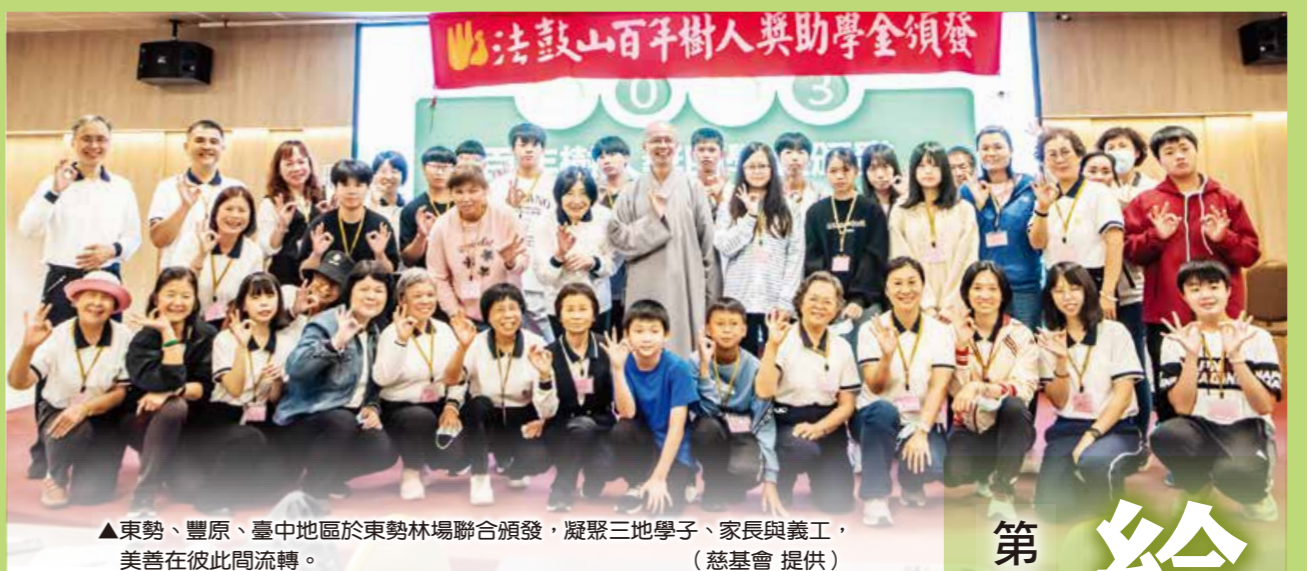
▲東勢、豐原、臺中地區於東勢林場聯合頒發，凝聚三地學子、家長與義工，美善在彼此間流轉。

「陳亭君／新北報導」香草進校園，歡喜收成！法鼓山人文社會基金會推廣多年的「香草進校園」課程，五月、六月陸續於台北市明湖國小、新北市林口國小、秀朗國小、桃園縣龜山國小、苗栗縣通霄國小等校舉行結業式，今年共有九十八個班級、近二千五百位學童參與，透過種植盆栽、體驗自己和大自然的關係，學習感恩，落實生活環保。