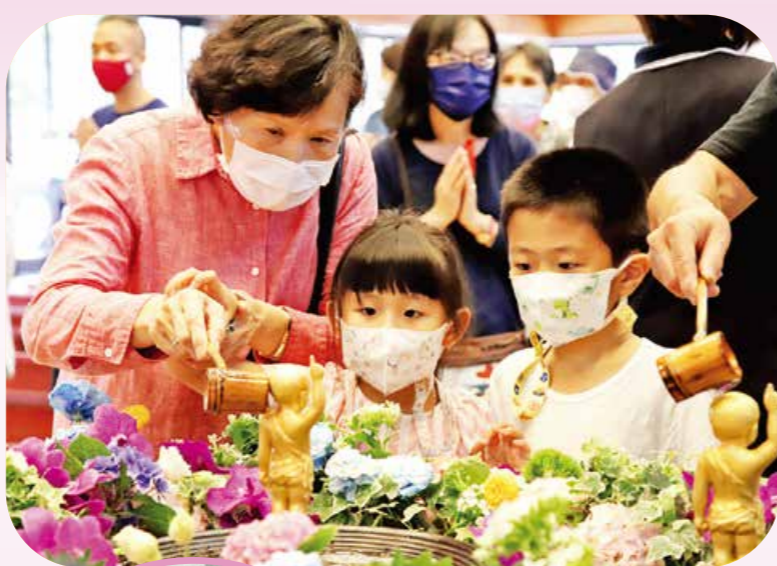
▲農禪寺浴佛法會後，全天開放大殿浴佛，許多家庭闔家大小一起前來。