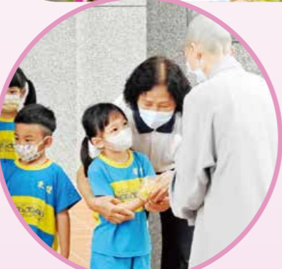
▲幼兒學童到信行寺浴佛，法師發送結緣壽桃，祝福平安快樂。