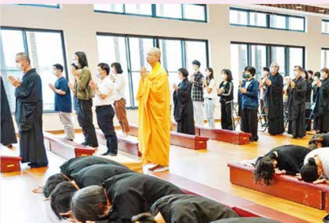
▲在主法法師帶領下，花蓮精舍信眾於浴佛法會中拜願。