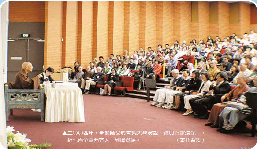
▲二〇〇四年，聖嚴師父於雪梨大學演說「禪與心靈環保」，近七百位東西人士到場聆聽。

2004年4月，聖嚴師父首次、也是唯一一次踏上南半球的澳洲，展開學術交流、跨宗教座談、弘講，關懷當地信眾。《他的身影2》拍攝團隊2022年底重訪澳洲，尋師足跡之外，更看見雪梨、墨爾本兩分會堅定傳承師願，將佛法的好，持續發揚出去。