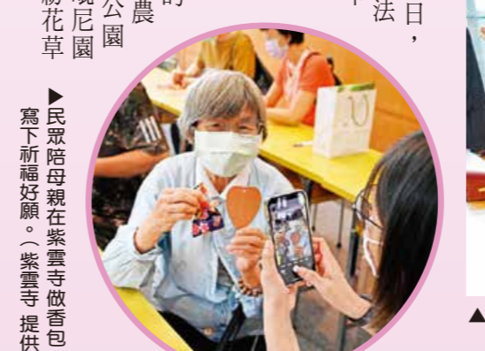
▲民眾陪母親在紫雲寺做香包，寫下祈福好願。