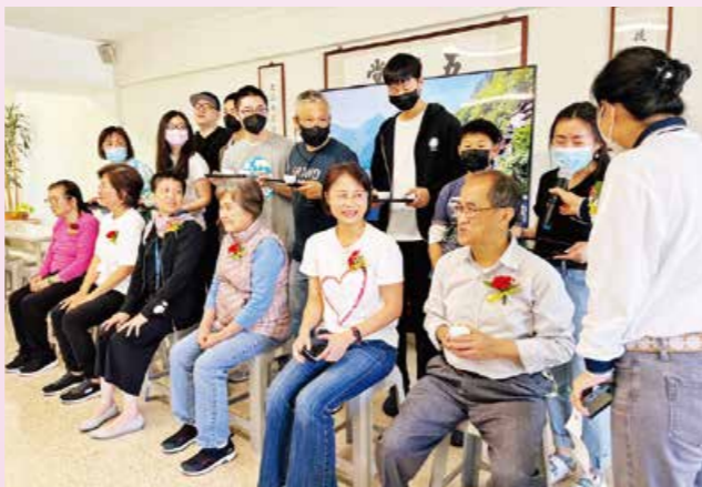
▲齋明別苑舉辦佛畫展，分享諸佛菩薩的莊嚴法相。