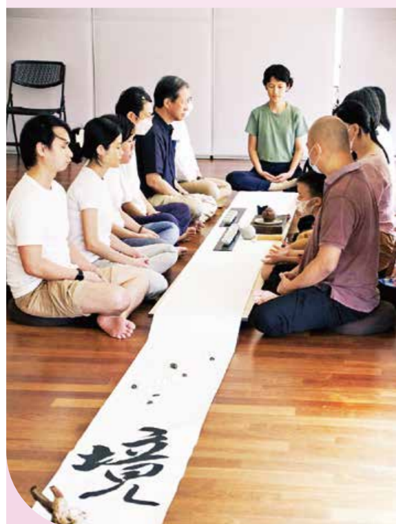
▲馬來西亞民眾參與茶禪活動，體驗靜心放鬆的浴佛節。