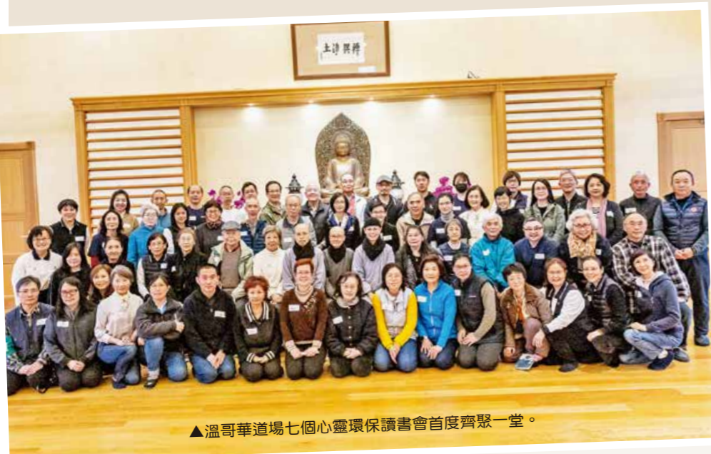
▲溫哥華道場七個心靈環保讀書會首度齊聚一堂。

「經過大家多年來的努力，溫哥華目前已有七個地區讀書會，包括剛滿二十週年的本拿比讀書會，及新成立兩個月的粵語讀書會。」監院常務法師關懷時表示，這次大會師看到各地讀書會全心投入，為了活動主軸「讓我為您介紹一本書」，多次進道場排練，力求完美呈現，整個過程令人感動！