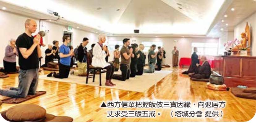
▲西方信眾把握皈依三寶因緣，向退居方丈求受三皈五戒。

退居方丈北美關懷 東西方弟子凝聚學佛願心 勉亞特蘭大、塔城、紐約、聖路易、芝加哥信眾 勤修戒定慧 身心常自在 【本刊訊】退居方丈果東法師北美關懷行，四月二十日至五月十六日持續前往亞特蘭大、塔城、紐約、聖路易、芝加哥等地，相隔六年，退居方丈再次到訪亞特蘭大，信眾們殷切期盼。四月二十三日於共修處舉辦茶敘，大眾一一分享與法鼓山接觸的因緣、學佛的心得，也回顧共修處發展歷程，氣氛溫馨。有信眾提問如何兼顧學佛與照顧家庭？退居方丈以「四安」回應，勸勉先安好家、安好同修的心。茶敘圓滿，每個人都收穫滿滿。四月二十七日，退居方丈接續前往佛州塔城分會關懷，並於三十日為當地信眾授三皈五戒。在果菩薩的接引下，塔城分會的西方信眾特別多，退居方丈讚歎大眾求法的願心，勉勵將佛法落實於生活，以慈悲對待他人、智慧處理事。五月一日搭乘晚班飛機，於隔天清晨抵達紐約的退居方丈，當天中午即於東初禪寺展開一系列關懷，包括五讀書會、義工團、助念團，並參加會員大會。在退居方丈的關懷勸勵下，大眾重新提起修行動力，發願護法學法，精進不懈。五日，退居方丈特地前往象岡道場關懷信眾。五月九日至十二日，退居方丈抵達密蘇里州聖路易聯絡處開懷，開示了除了佛法之外，退居方丈也提醒大眾，面對無常，要先學會安心；遇到挫折，也要調整心態，以善念祝福對方。五月十三日轉往芝加哥分會，與當地信眾餐敘，並了解道場建設相關事宜，榮譽董事會會長黃楚琪也專程從臺灣前來關懷。十四日上午舉行浴佛法會，有四十多人參加，包括芝加哥大學、西北大學多位學生。午齋時，同學們對平易近人的退居方丈提出不少有趣的問題，氣氛輕鬆。下午授三皈五戒，共有十二位東西方人士成為佛弟子，退居方丈親自為每一位菩薩戴上佛牌，歡喜結法緣。五月十七日起，退居方丈飛往加拿大多倫多，繼續加拿大與美國的關懷之行。