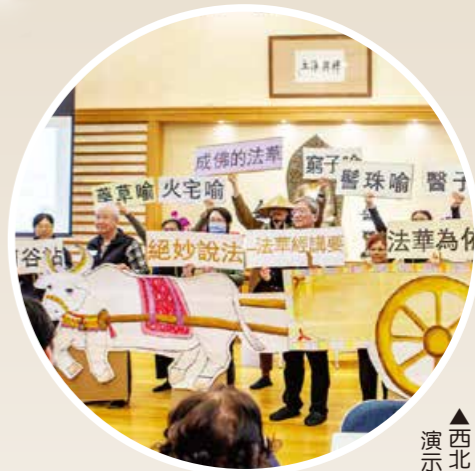
▲西北溫讀書會啟動大白牛車，將《絕妙說法》演得栩栩如生。

今年世界閱讀日，溫哥華七個心靈環保讀書會首度大會師，交流「讀懂一句，受用一生」的心得，並為大家推介一本書，哪一本聖嚴師父著作，是讀書會成員的智慧法寶？讓我們一起來看看。