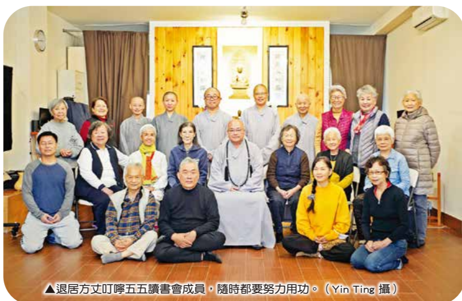
▲退居方丈叮嚀五讀書會成員，隨時都要努力用功。

「洄瀾山間春意，西寶鳥鳴進觀園」，4月29日，花蓮精舍於在二樓文化藝廊舉辦首次藝文特展「西寶繪畫聯展」開幕茶會，邀請西寶國小學童以「洄瀾山間」為題，十四幅畫作帶領民眾走進太魯閣，感受百花齊放與森林之美。畫展呼應四種環保的理念，由策展教師唐毓宏帶領學童走進自然寫生，培養愛護環境的心，並用回收畫框落實生活環保。副寺常空法師表示，畫展的主題與精神與「自然環保」相應，期盼藉由畫展的交流，共同推廣環境保育。(編輯室)