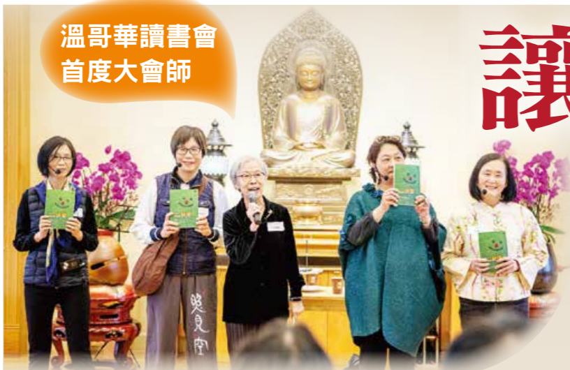
▲列治文讀書會以風趣的小話劇，介紹師父著作《真正的快樂》。