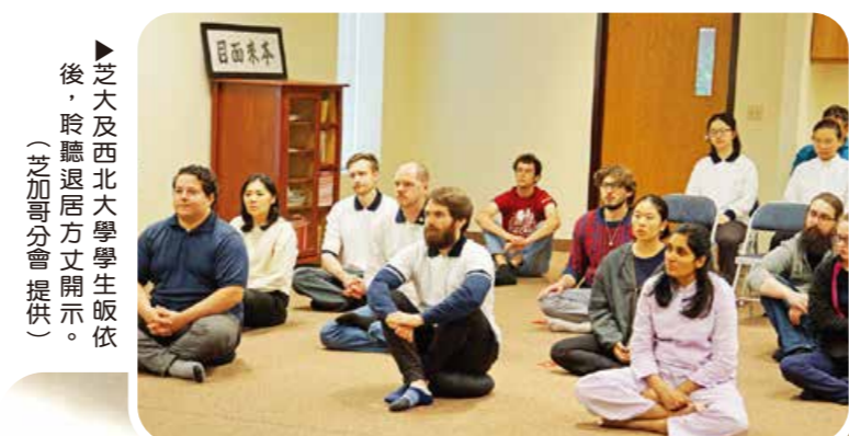
▲芝大及西北大學學生皈依後，聆聽退居方丈開示。