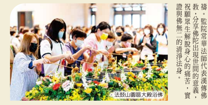
法鼓山園區大殿浴佛

五月對佛教徒來說，不僅是溫馨的月份，也是感恩的季節。結合了浴佛節和母親節的各項活動，四月底至五月初間，於法鼓山全球各分支道場陸續展開。 在海外，除了各道場所舉辦的浴佛法會，四月二十九日，美國東初禪寺還受邀參與紐約佛教聯合會、哥倫比亞大學佛教會聯合的「衛塞節」慶祝活動。經歷新冠疫情後，僧俗四眾超越國籍、種族、宗教共聚一堂，以虔誠的誦經為世界祝福，監院常華法師代表漢傳佛教，分享佛陀出現世間的意義，祝願眾生解脫身心的痛苦，實踐與佛無二的清淨法身。