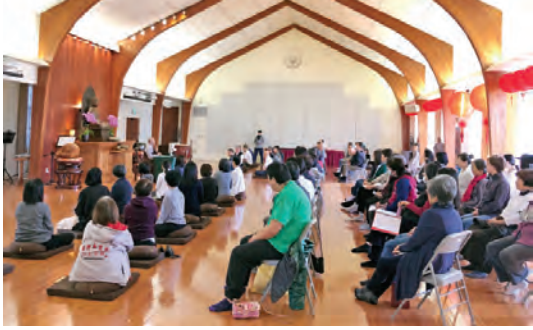
▲東初禪寺舉辦都市禪修週，緬懷聖嚴師父弘揚漢傳佛教的重要基礎。

【本刊訊】今年為聖嚴師父圓寂十一週年，二月一日起，北美各地道場、分會，以禪修週、法會、專題講座等方式緬懷師恩。東西方信眾弟子「傳心燈、起願行」，願在不同地方發光發熱，接續師父在西方弘揚漢傳佛教的大願。