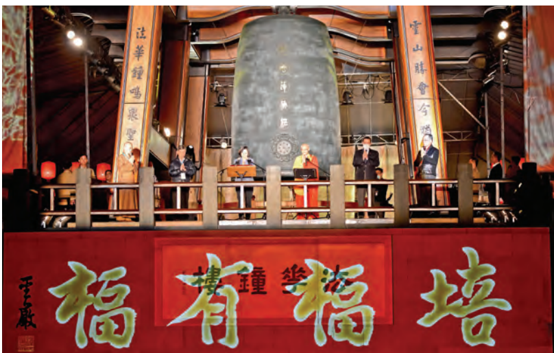
▲方丈和尚揭示年度主題「培福有福」，與現場三千餘位民眾祝福共勉，祈願國家、社會及全世界平安。

▲方丈和尚帶領近百位僧眾傳燈，現場同步直播，全球四眾弟子共願祈福迴向疫區平安。