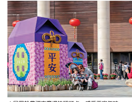
▲民眾於農禪寺廣場拍照打卡，感受平安年味。