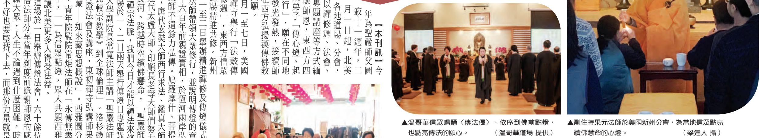
▲溫哥華信眾唱誦〈傳法偈〉，依序到佛前點燈，也點亮傳法的願心。 ▲副住持果元法師於美國新州分會，為當地信眾點亮續佛慧命的心燈。