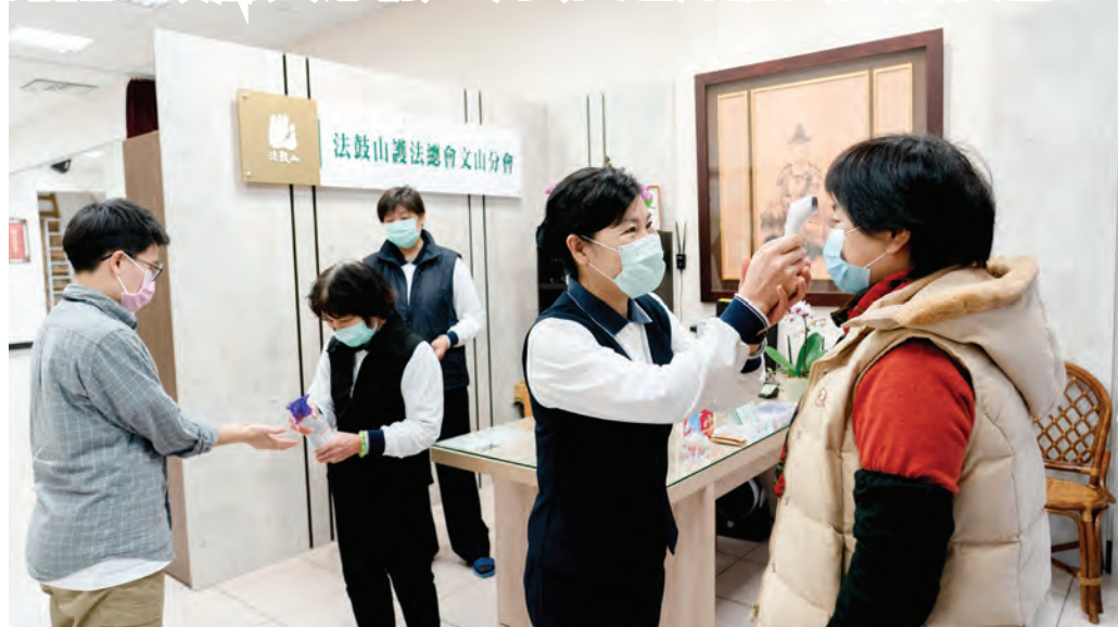
▲因應新冠肺炎疫情，法鼓山各地分支道場、護法分會做好各項防護措施，為來訪信眾量額溫、消毒雙手，護念彼此的健康。

法鼓山各地 2 月至 4 月 5 日活動暫停 鼓勵大眾線上用功 運用佛法安度疫情