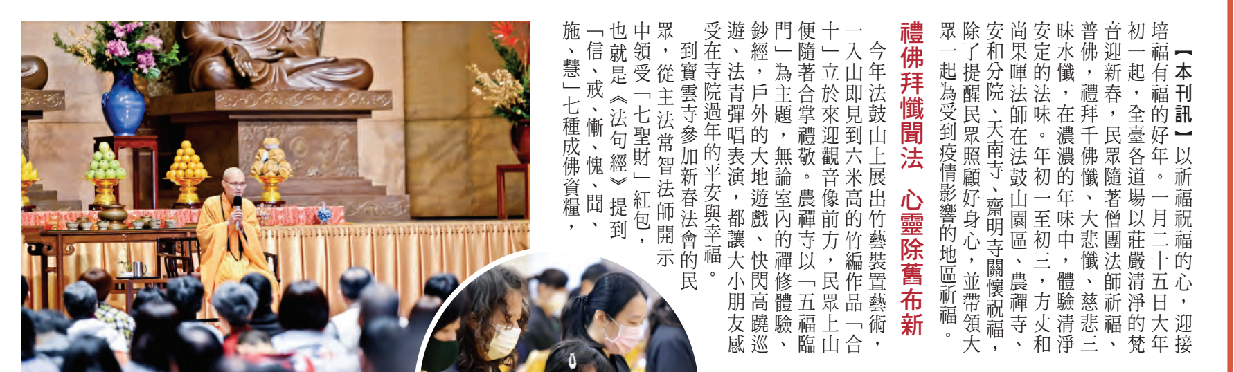
▲法鼓山大殿新春祈福法會結束後，方丈和尚為大眾開示祝福。 ▲參加寶雲寺新春法會的信眾全程戴上口罩，為眾祈福。 ▲東西方信眾齊聚東初禪寺，一同拜懺迎新。