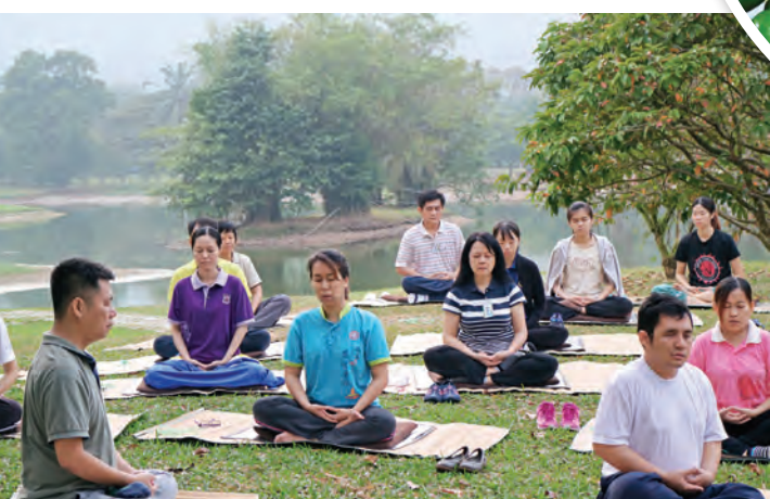
▲馬來西亞全國教師佛學研習班邁入第二十週年，每年皆有許多來自各地的老師前來參與，共同研討交流，學習佛法。

由定而生慧，心很安定又能清楚觀照，定慧等持才是大乘佛法所指的「三昧」；「水」所流瀉的，不只是表相，而是內心的垢穢；「懺」則是反省後承擔責任；「法」則是隨時隨地覺照，始能去惡向善，最後擺脫自我的執著，善的不執著，惡的也不執著，才是解脫之道。