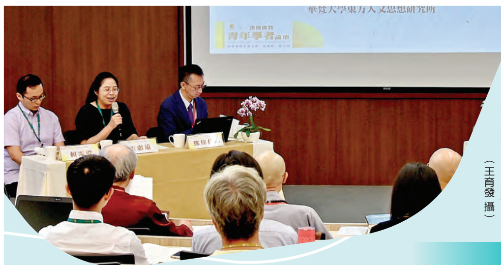
▲交流座談會上，青年學者分享研究與考察的寶貴經驗。

【林何臻／金山報導】由中華佛學研究所主辦的「二〇一八漢傳佛教青年學者論壇」，九月七至八日於法鼓文理學院舉行第二階段論文發表，十八位青年學者的文獻、研究方法與視野的成果，十位國內外文史哲、宗教等系所教授與講師，令人感受漢傳佛教學術社群經驗傳承、相互提攜的溫暖活力。