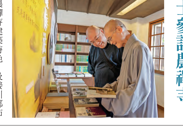
▲農禪寺建築特色，及接引都市族群學佛、禪修、參與法會共修等弘化活動，留下深刻印象。（文／編輯室）

深入默照禪四十九圓滿 【釋演捨／金山報導】法鼓山於七月七日至八月二十五日舉辦默照禪四十九，共計兩梯次禪七、禪十四、禪二十一，參與禪眾來自中國大陸、香港、新加坡、馬來西亞、越南、美國、加拿大、澳洲、盧森堡等地，每梯次參加人約八十人，其中有梯次五十五人圓滿全修。 由於禪堂進行木作修繕工程，默照四十九移到法華書苑（原居士寮）舉辦，距離二〇〇一年聖嚴師父回臺第一次在此主持默照禪四十九，轉眼已經過了十七年。當年也曾參加的禪眾表示，在相同的地點，聽著同樣的師父影音開示內容，時空交錯宛如靈山勝會猶在，感受到師父法身常存，不曾離開。 禪期中，聖嚴師父影音開示以「放捨諸相、休息萬事、身心一如、動靜無間」四句偈為核心主軸，貫穿整個禪期，說法內容包括長蘆宗頤的《坐禪儀》、宏智正覺的《默照銘》及《坐禪箴》等，禪法觀念與方法完整而具次第性。 全程擔任總護的禪堂監院常秉法師表示，長時間的禪修，能讓禪眾充分調理身心，深入體驗禪法，乃至達到動靜一如的境界。明年（二〇一九）預計試辦九十天，希冀藉此培養傳承中華禪法鼓宗的師資人才。