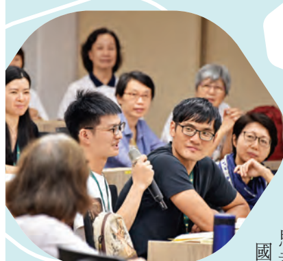
▲論壇中，台上台熱熱交流，展現學術社群的活力。