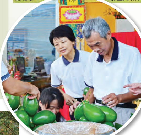
▲德華寺信眾合力布置普賢桌，願將飲食化成無量，布施眾生。