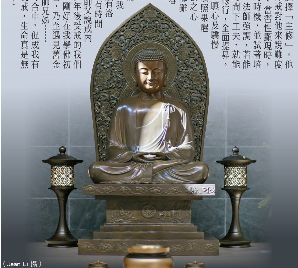
(Jean Li 攝)

能夠參加菩薩戒的諸多因緣和合，也讓我深感不可思議：剛好有洛杉磯道場主辦戒會、有時間可以參加，以及聖嚴師父說戒內容被錄影下來，讓多年後受戒的我們得益；再推進一點，剛好在我學佛初期就接觸到師父的書，乃至遇見舊金山道場和許多精進的師兄姊……種種無量無數的巧合中，促成我有幸於此時此地圓滿受戒，生命真是無法預料，我深深感恩！