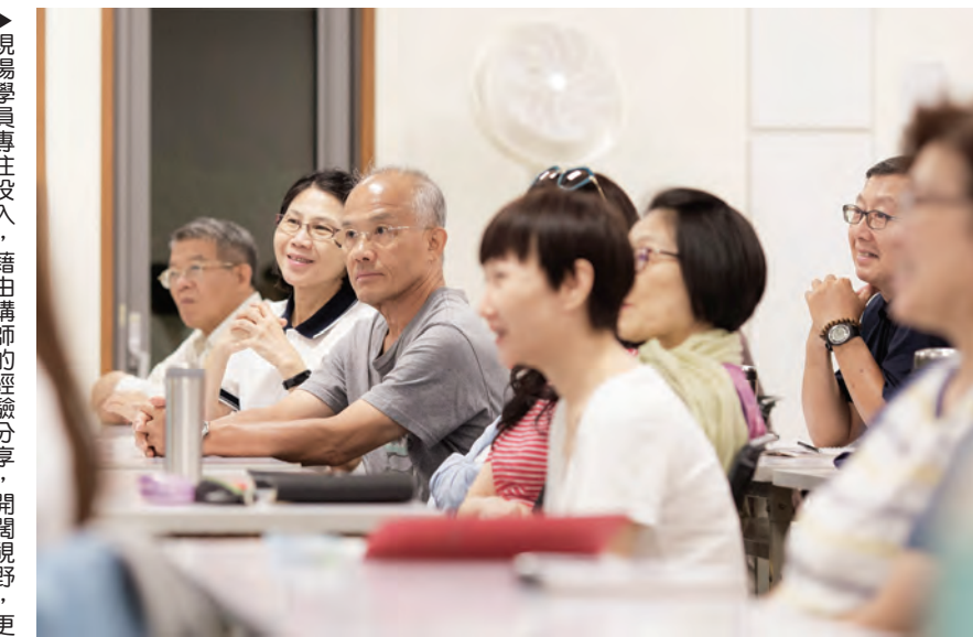
現場學員專注投入，藉由講師的經驗分享，開闊視野，更提起精進開放的心，持續學習不中斷。

在佛法研讀班這十二堂課裡，除了認識觀自在菩薩、《心經》，也因為學習經典所講的觀念和方法，而與自己的生命產生連結，朝向「自在」的方向邁進！ 對呀！有多少人享受著人生中的快樂，而不自覺這些快樂其實附帶了很多條件，若是其中一個條件沒有了，快樂就隨之消失。以前我就是這樣的顛倒觀念中，活了幾十年，情緒起伏不定，完全被外在控制了自己的生命。 自由自在，心無罣礙。練習把心帶回到純淨的狀態，不多加評論、比較、分別，不染著在現象上，少欲知足，自然自在。 原來每一天都可以那麼美好；生命中的每一個人、每一件事、每一樣東西，都是